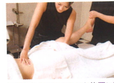
下垂した内臓をあるべき位置に戻す秘技でウエストラインも変化!