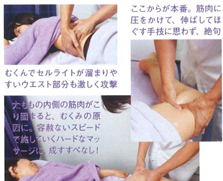
むくんでセルライトが溜まりやすいうエスト部分も激しく攻撃