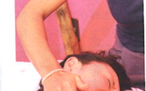
オリジナルの手技を多用し、二の腕や背中の中層の老廃物がこりを徹底的に促す。老廃物がこり固まった部分は電流が流れるような感覚!