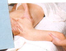
肩甲骨の周辺の詰まりをこのようにケア。これだけで背中がすっきり!

体の悩みや希望に合わせ、オーダーメイドで組み立てていく独自メソッド満載のメニュー。1回の施術で心と体が完全リセット!