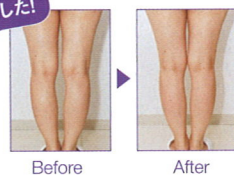
足の外側の肉が削がれた!! 声も出せない痛さとはこのことか...と思うほどの痛み。翌日は筋肉痛に見舞われ階段が昇れず。でも、むくみが取れ、すっきりしたラインを維持できています。通えば、美脚は間違いない!

霜降り脂肪を溶かし高周波マシンと筋膜に働きかける手技でむくみやこりを軽減。太ももど1回で2〜3cmが実現するそう。