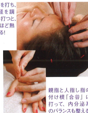
親指と人差し指の付け根「合谷」に打って、内分泌系のバランスも整える