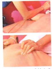
まずは脊柱ゾーンの溜まった毒素を入念に押し流し、背中や脇のこりを解消