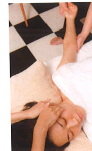
あごまわりを中心にした顔の筋肉と骨格を矯正することでフェイスラインや首まわりもほっそり