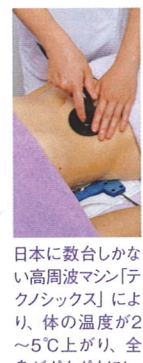
日本に数合しかない高周波マシン「テクノシックス」により、体の温度が2〜5℃上がり、全身がポカポカ!

野先生。涙のハンドマッサージ終了後には、むくみなしの細い足に変身。続けられ、理想のラインが手に入るのだとか!